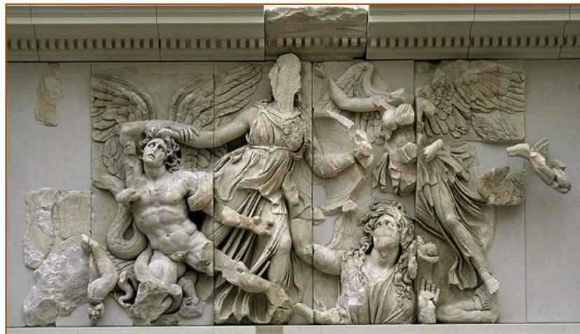
Fig. 4. Atenea lucha contra el gigante Alkyoneus. Gran Altar de Pérgamo – Friso este. Segundo siglo a. C. Acrópolis de Pérgamo. Mármol. Berlín, Museo de Pérgamo

Aunque no es demostrable, hay indicios importantes de que la Victoria fuera dedicada en Samotracia por los rodios para celebrar sus victorias navales sobre las fuerzas de Antíoco III. Tras ser expulsado de Grecia en 191 a. C. por los romanos y sus aliados griegos, entre los que se hallaban los rodios, Antíoco había organizado una nueva flota que esperaba utilizar para impedir que los romanos lo persiguiesen hasta Asia, pero en 190 a. C., una flota aliada mandada por un eficaz almirante llamado Eudemo destruyó las fuerzas seleúcidas en las batallas de Side (Cilicia) y Mioneso (cerca de Teos en Jonia). Eudemo regresó en 190 a. C. a su isla, fresco y exultante por sus victorias, y encargando a uno de los artistas prestigiosos de su tiempo un monumento asombroso que habría de erigirse en el santuario panhelénico de Samotracia, donde las deidades que presidían eran, entre otras cosas, las protectoras de los marineros 3 .