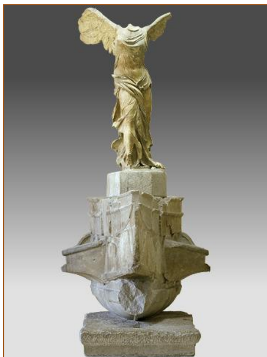
Fig. 1. La victoria sobre la proa de un barco