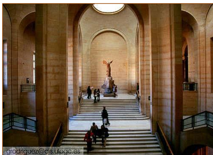
Fig. 3. Victoria de Samotracia en la escalera Daru del Museo del Louvre