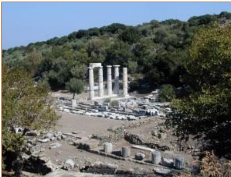
Fig. 5. Santuario de Samotracia

El monumento estaba en un pequeño edificio, de los cuales sólo quedan los cimientos, protegido por muros de contención, recientemente restaurado, pero parcialmente oculto debajo de las piedras de derrumbes. El edificio tenía tres paredes, en una de las cuales había una apertura en la parte delantera que formaba una terraza con un pórtico. Dado el excelente estado de conservación de la superficie de mármol de la Victoria, el edificio sin duda tuvo un techo. La victoria monumental fue sólo una de las innumerables ofrendas hechas en el santuario. Fue consagrada, sin duda, en agradecimiento a los dioses después de una batalla naval. Por desgracia, las excavaciones no han descubierto la inscripción dedicatoria, en la que se encontraría la situación en la que fue construido el monumento, el nombre del donante, y tal vez incluso la identidad del escultor.